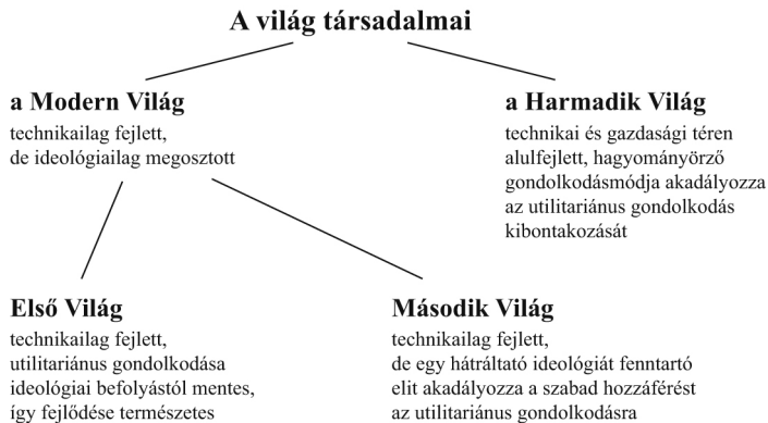
3. ábra A világ három része a duális felosztás alapján (PLETSCH, C. 1981 nyomán) Figure 3 Three worlds based on a dual divide (after PLETSCH, C. 1981)

csak a tradicionális/modern felosztás újratermelése és fenntartása történik. E két világ áll szemben a technológiailag és gazdaságilag is elmaradott Harmadik Világgal (PLETSCH, C. 1981; SHARP, J. 2008).