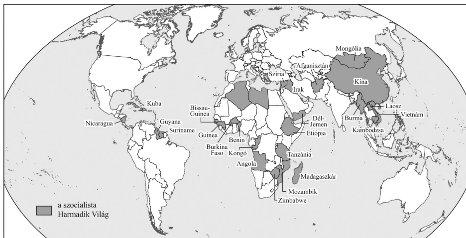
2. ábra A szocialista Harmadik Világ (DRAKAKIS-SMITH, D. 1987 nyomán) Figure 2 The socialist Third World (based on DRAKAKIS-SMITH, D. 1987)

te-afrikai ország szintén ekkortájt kezdett demokratikusabb kormányzat kiépítésébe. Ezzel kapcsolatosan ROBERT POTTER és szerzőtársai (2008) arra hívják fel a figyelmet, hogy a fenti lehatárolások sem lehetnek statikusak és örök érvényűek.